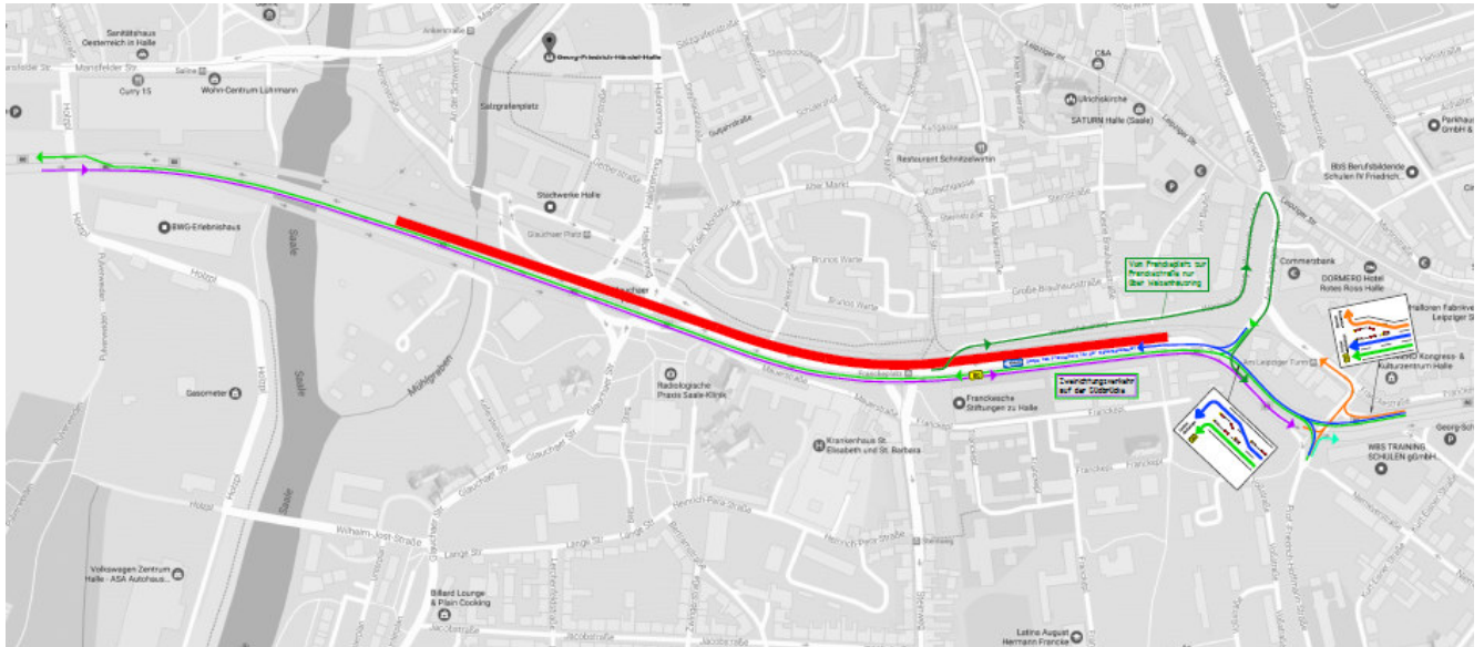
Verkehrsführung Bereich Hochstraße über den Franckeplatz ab 19.06.2017

Am 19. Juni beginnt die Sanierung der Nordbrücke der Hochstraße über den Franckeplatz im Zuge der Straße „An der Magistrale“. Der Verkehr wird über die Südbrücke zweistreifig im Gegenverkehr geführt.