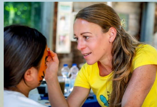
↑ Auch das Kinderschminken war wieder sehr beliebt bei den Kindern