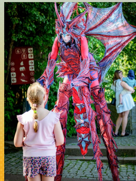
↓ Die Stelzenläufer sorgten für viel Aufmerksamkeit