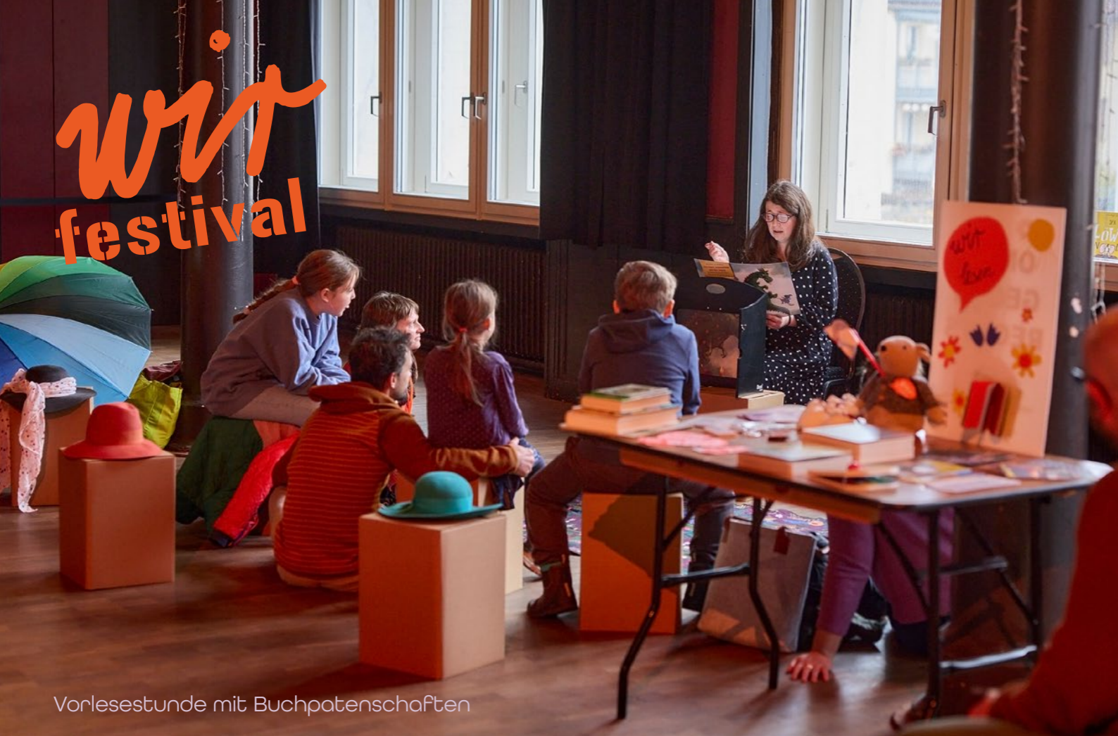
Vorlesestunde mit Buchpatenschaften