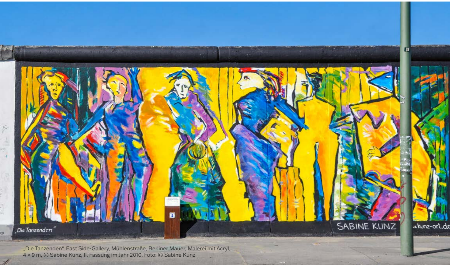
„Die Tanzenden“, East Side-Gallery, Mühlenstraße, Berliner Mauer, Malerei mit Acryl, 4 x 9 m, © Sabine Kunz, II. Fassung im Jahr 2010

Sabine Kunz zählt zu den prägenden Künstlerinnen Sachsens-Anhalts. Sie studierte an der Burg Giebichenstein Kunsthochschule und entwickelte im Laufe der Jahre eine sehr eigene künstlerische Handschrift. Ihre Arbeiten wurden nicht nur regional, sondern auch überregional ausgestellt. Ab dem 1. April zeigen wir in einer Ausstellung einen Ausschnitt ihres künstlerischen Schaffens.